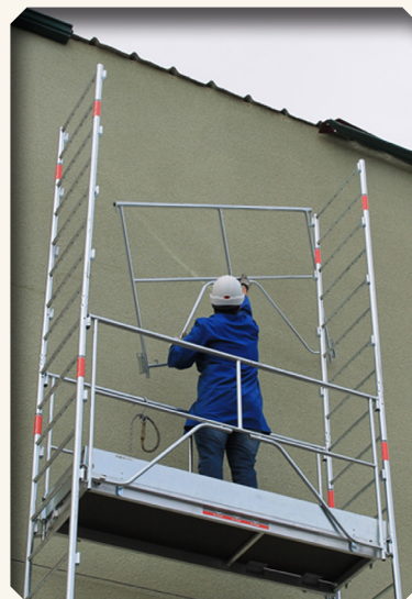
2. Mise en place des garde-corps

La fixation des garde-corps est impérative pour passer à l'étape suivante. L'ordre de montage est bien définit.