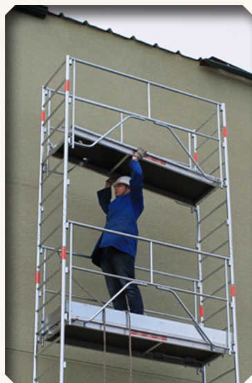
3. Mise en place du plancher

Avec le R SECU, travailler l'esprit libre !