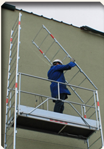
1. Mise en place des échelles

Le Montage et Démontage en Sécurité catégorie 1 permet d'assurer la sécurité absolue de l'opérateur lors des phases les plus délicates ( montage et démontage ).