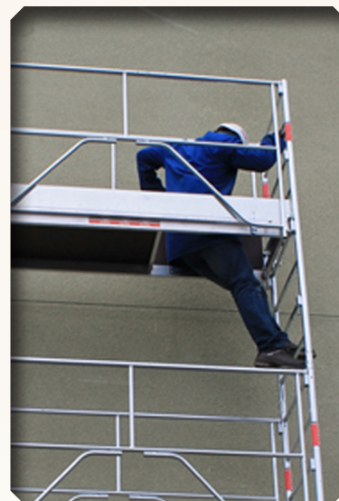
4. Accès à l'étage supérieur sécurisé